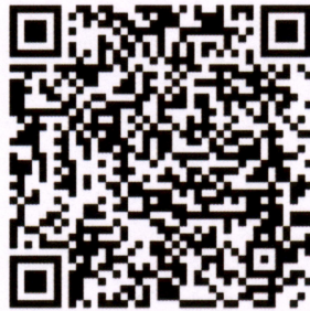
2026年第一期差错争议业务面授培训 报名二维码