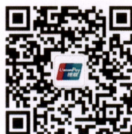
“学支付”公众号二维码 进入首页， 建议关注

请于5月22日前完成报名及缴费，培训指南于培训前发送，请留意邮箱通知。培训结束后由“中国银联股份有限公司”统一开具培训费发票。